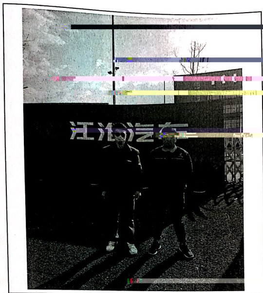
现场监测人员与检测人员合影